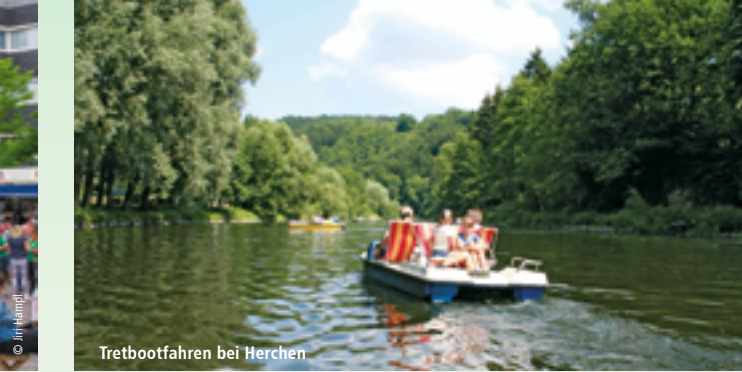
Tretbootfahren bei Herchen