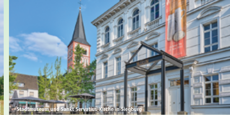
Stadtmuseum und Sankt Servatius-Kirche in Siegburg