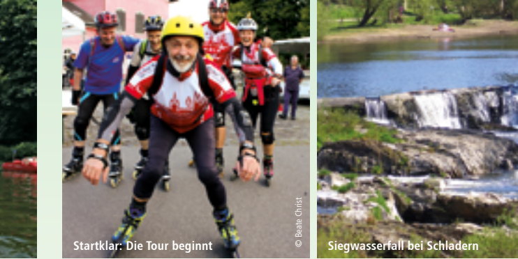
Startklar: Die Tour beginnt Siegwasserfall bei Schladern