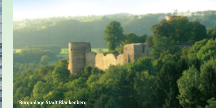
Burganlage Stadt Blankenberg