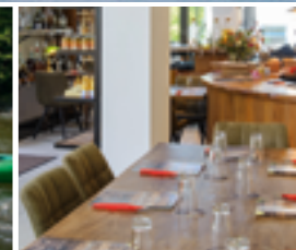
Restaurant „Zorlu Feine Kost“

In unmittelbarer Nähe zur Rheinmetropole Köln und der Bundesstadt Bonn liegt Eitorf inmitten der Naturregion Sieg. Das gesunde Klima, die abwechslungsreiche Mittelgebirgslandschaft mit ausgedehnten Wäldern, malerischen Tälern, waldreichen Höhenrücken, herrlichen Fernsichten sowie die naturnahe Flusslandschaft der „Sieg“ bieten eine Fülle von Freizeit- und Erholungsmöglichkeiten. Pures Wandervergnügen in einer reichen