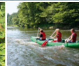
Kanufahren auf der Sieg